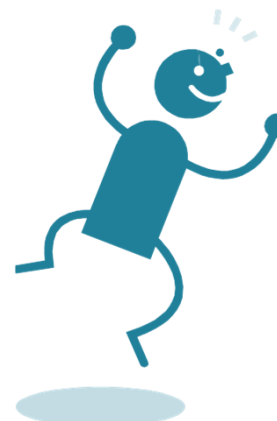
LAG & Berater