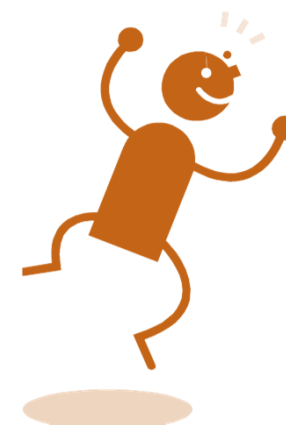
Bewilligungs- stelle ArL